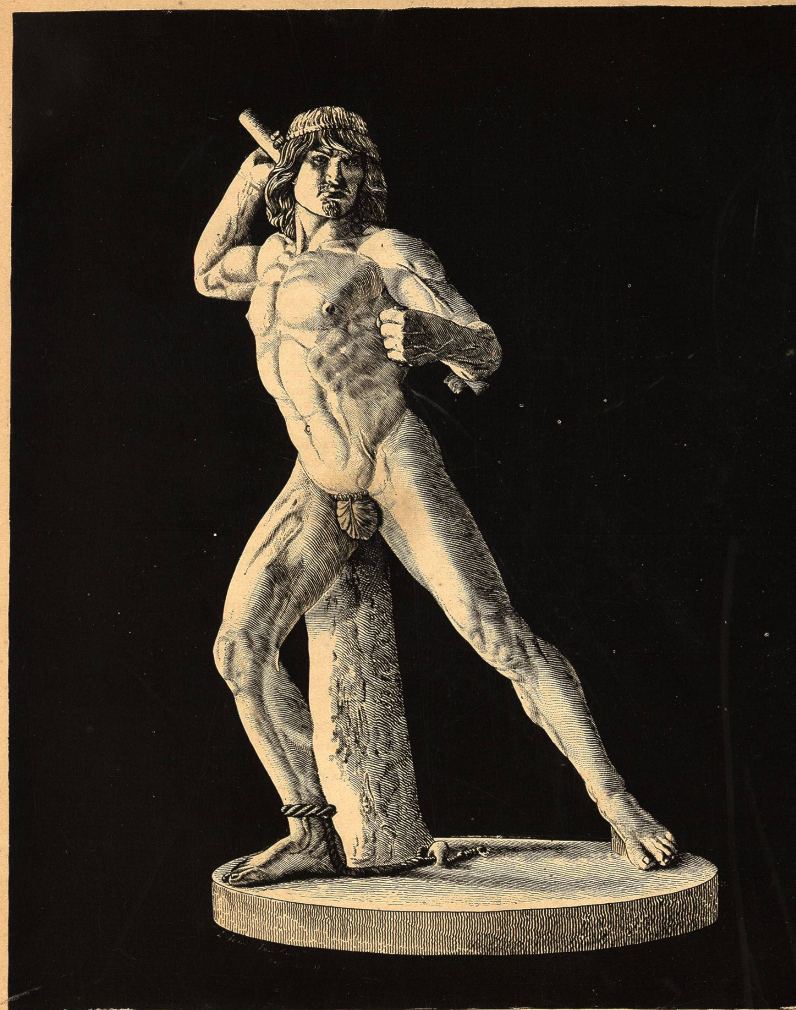
UN GLADIADOR AZTECA.

De venta en él, todas las Medicinas de Patente más en boga, tanto del país, como extranjeras. Precios muy cómodos. Descuento en ventas por mayor. [4—44]