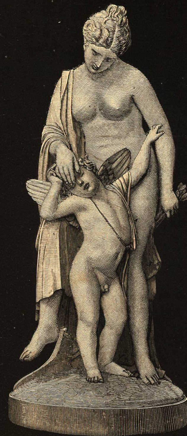
UNA BURLA AL AMOR.

GRUPO EN MARMOL POR GABRIEL GUERRA—ACADEMIA DE SAN CARLOS.