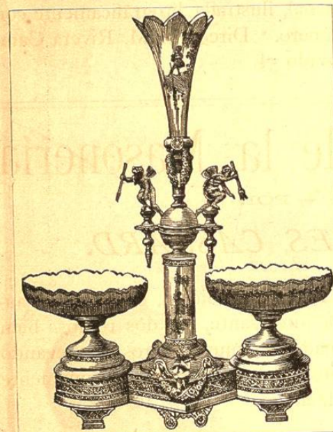
CENTRO DE PLAQUE PARA MESA.