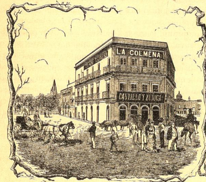
RUMBO DE SAN JUAN DE DIOS (GUADALAJARA).