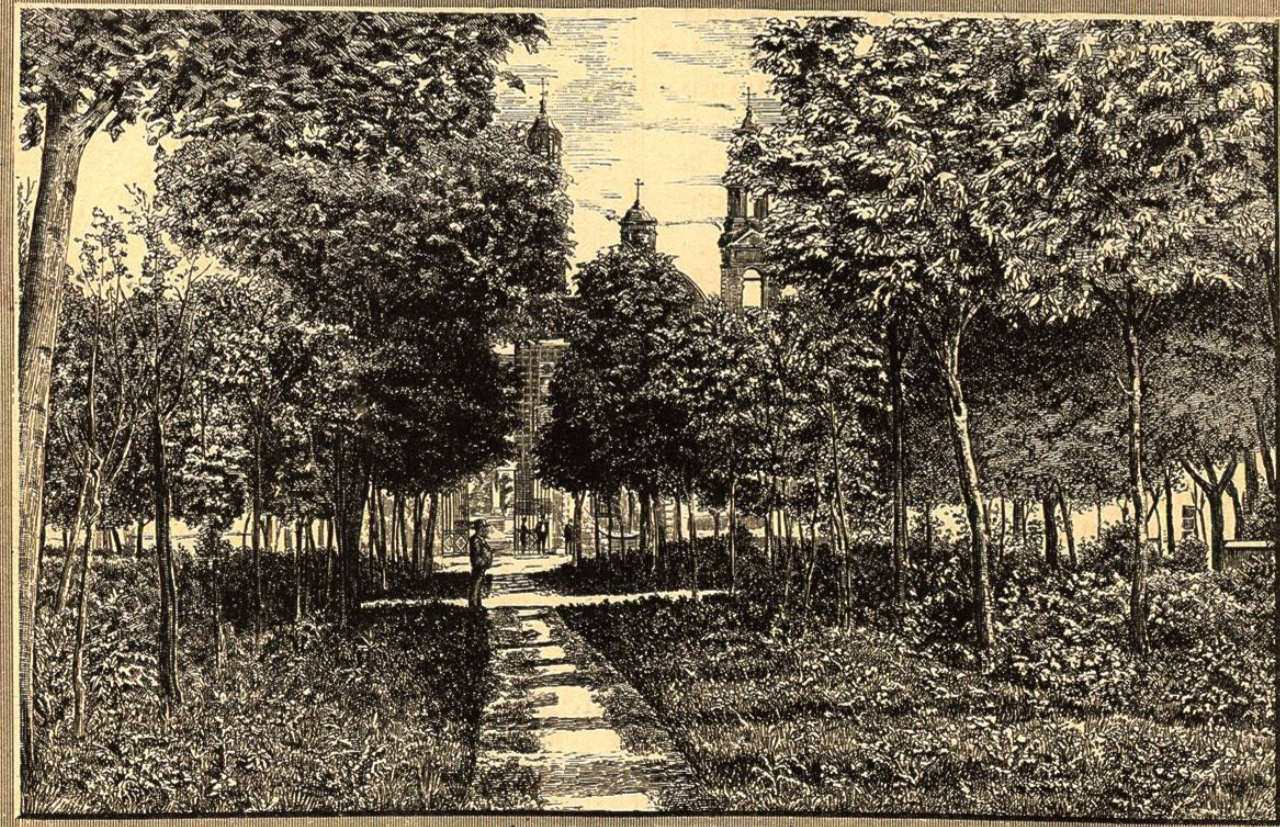
CIUDAD DE PUEBLA.