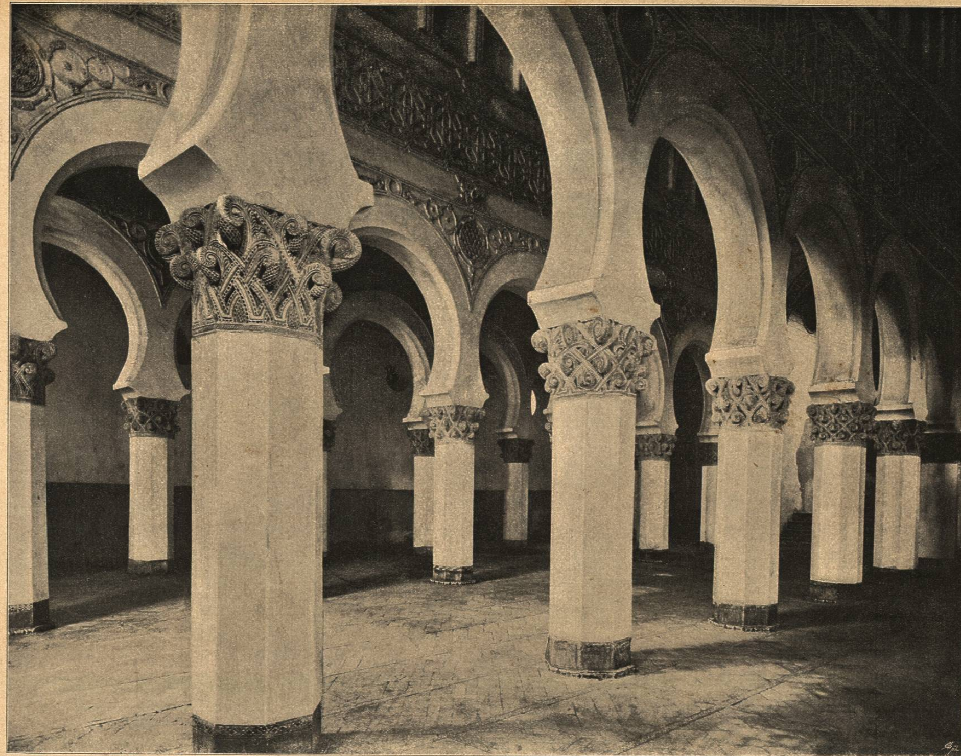
INTERIOR DE SANTA MARIA LA BLANCA EN TOLEDO

ciendo la particularidad de que una porción de esta ruina se conserva en pie por un milagro de equilibrio que sorprende al que lo examina, como se conservan en escarpadas montañas algunas enormes piedras que, careciendo casi de base, han desafiado y desafían la furia de los elementos manteniéndose incommovibles y erguidas. En el fondo se divisa la torre llamada del Homenaje, que, á juzgar por lo que de ella queda, debió ser esbelta y de mucha mayor altura de la que tiene en la actualidad, pues sin duda tuvo otro cuerpo superior con sus almenas y torreonos correspondientes.