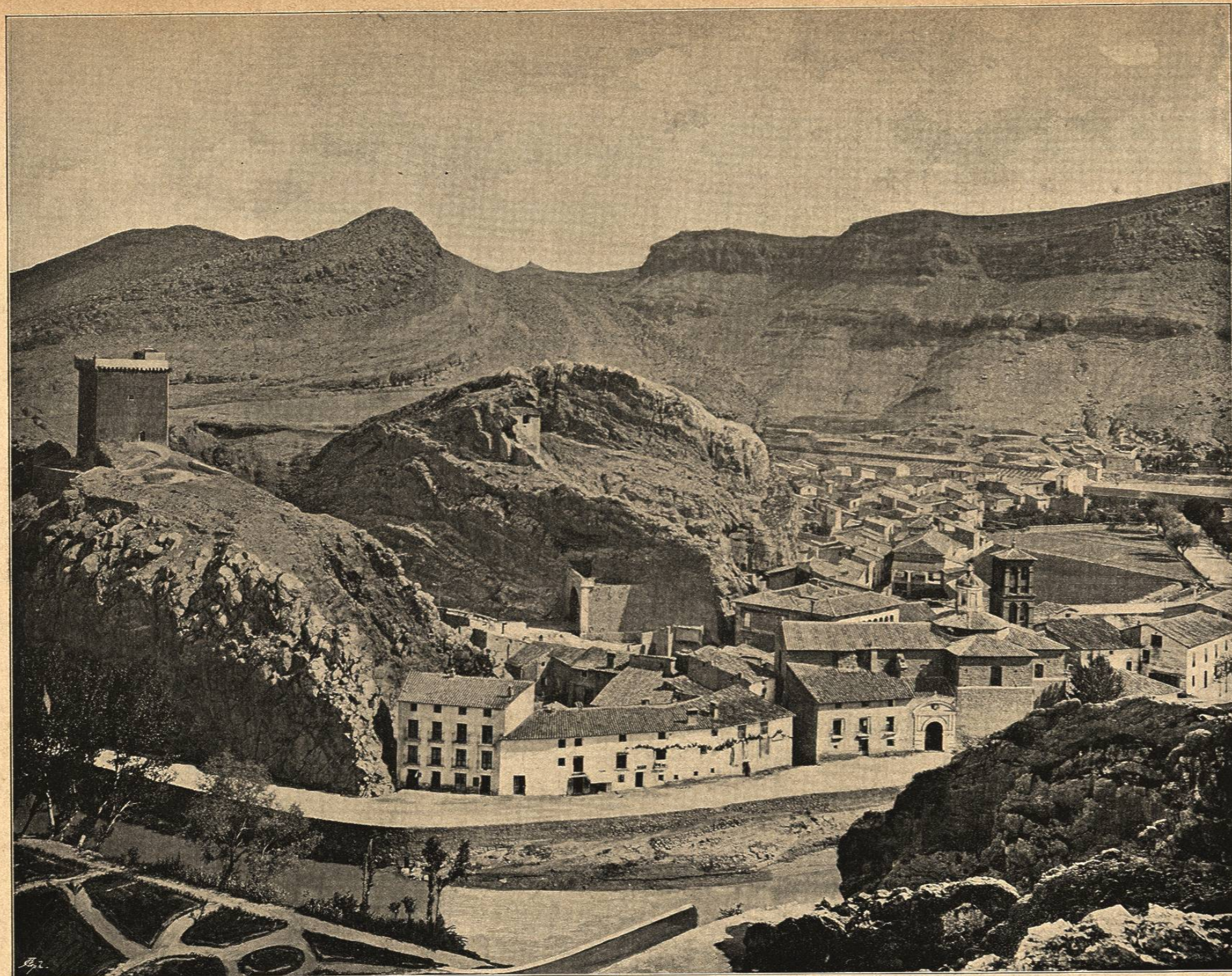
VISTA GENERAL DE ALHAMA (ARAGON)