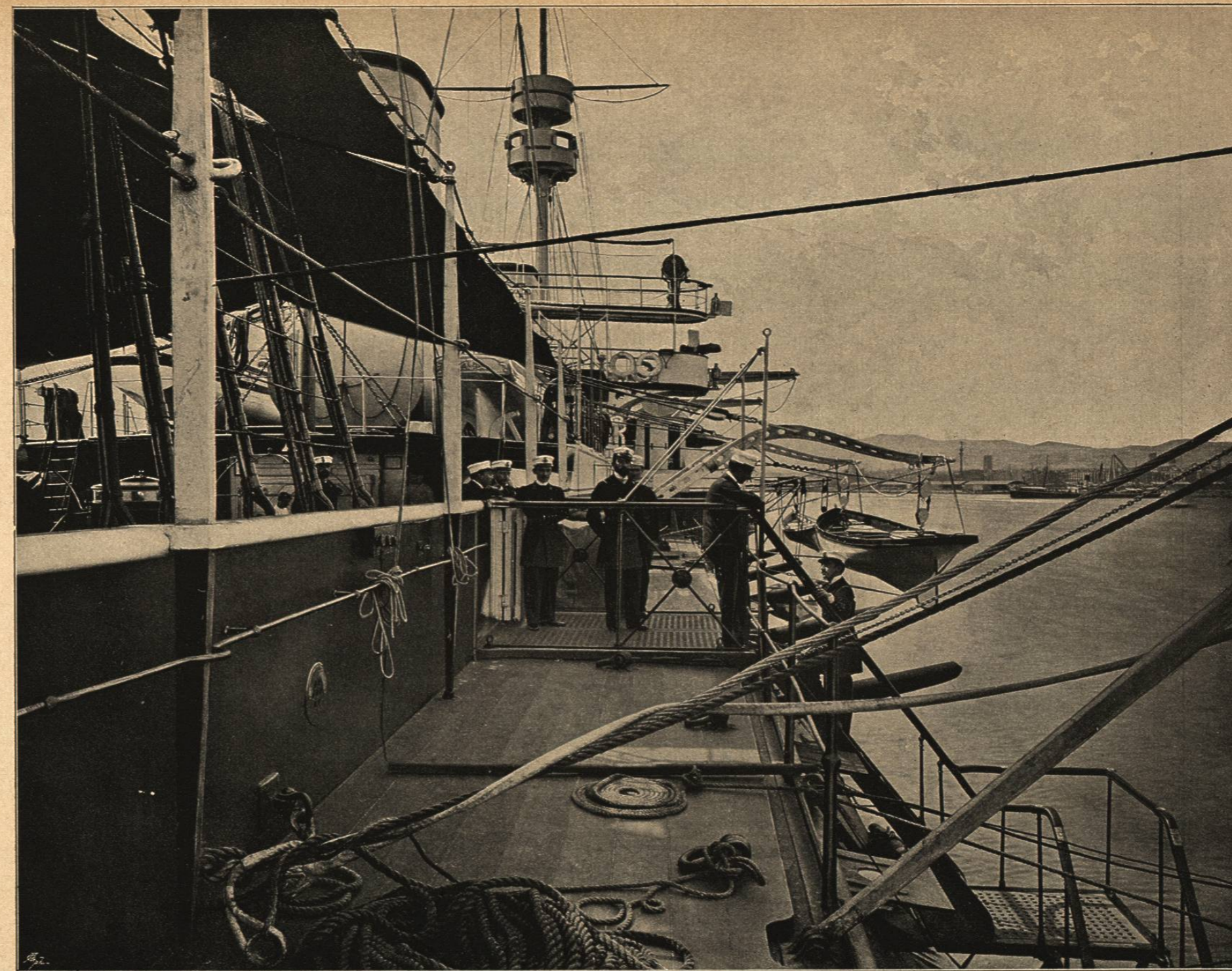
EL ACORAZADO «PELAYO» VISTO POR UNO DE SUS COSTADOS

cipal el ácido carbónico y el nitrógeno. Las aguas brotan en terreno cretáceo, tienen una temperatura de 33 y 35 grados, y son diáfanas, incoloras é inodoras. Clasificadas entre las aciduladas termales, las recomienda la ciencia para la curación de las enfermedades reumáticas, particularmente en las formas dolorosas, en la diatesis úrica, catarros vesicales, afecciones uterinas, histerismo, cólicos nerviosos y biliosos, gastralgias y dispepsias, infartos crónicos del hígado y bazo, gran número de parálisis, corea y otras afecciones nerviosas, catarros bronquiales y diferentes dermatosis. Los romanos las conocieron ya con el nombre de «Aque bilibitanæ», y los árabes tradujeron á su idioma el nombre de los baños y los llamaron «Alhama».