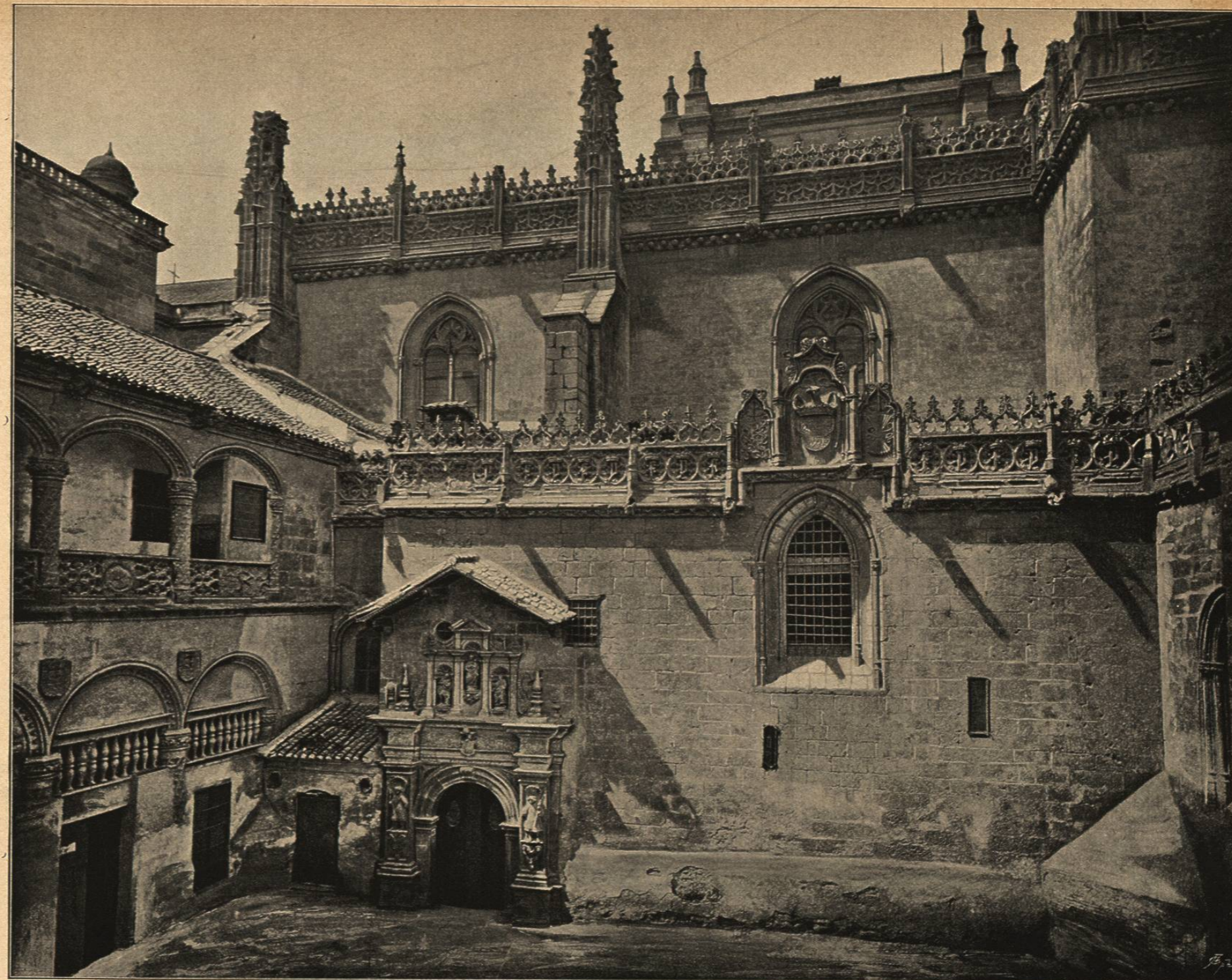
VISTA EXTERIOR DE LA CAPILLA REAL DE GRANADA

constituída por una profunda arcada en degradación dividida por un pilar sobre el cual se abre un nicho: á uno y otro lado de la puerta se destacan dos elegantes ventanas ojivales. A los dos lados mayores del edificio hay puertas y ventanas del mismo gusto: arrimado á las torres de los ángulos sube un bello agregado de molduras rematado en una repisa, y descansando en ésta aparece una estatua cobijada por aéreo doselete. Entre las puertas y ventanas citadas hay gallardos estribos que terminan en torrecillas, y en lo más alto de los muros una sucesión de ventanas cuadradas, divididas de cuatro en cuatro por las indicadas torrecillas y coronadas por una serie de almenas endentadas. El interior consta de una sola pieza con naves que separan altas columnas estriadas en espiral.