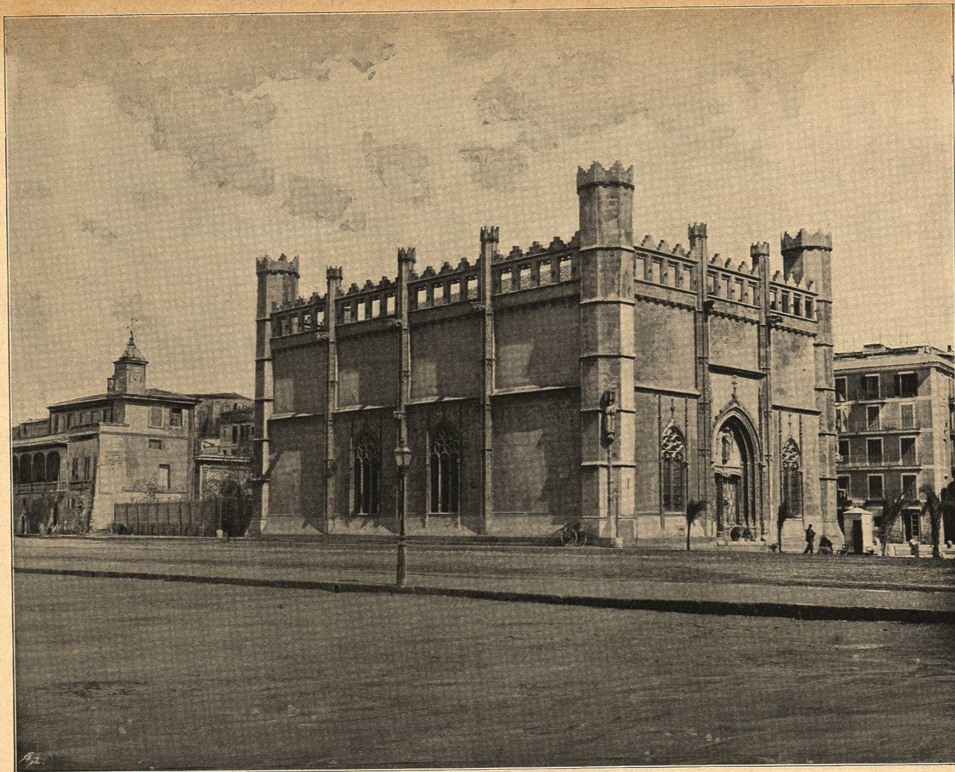
LA LONJA DE PALMA DE MALLORCA