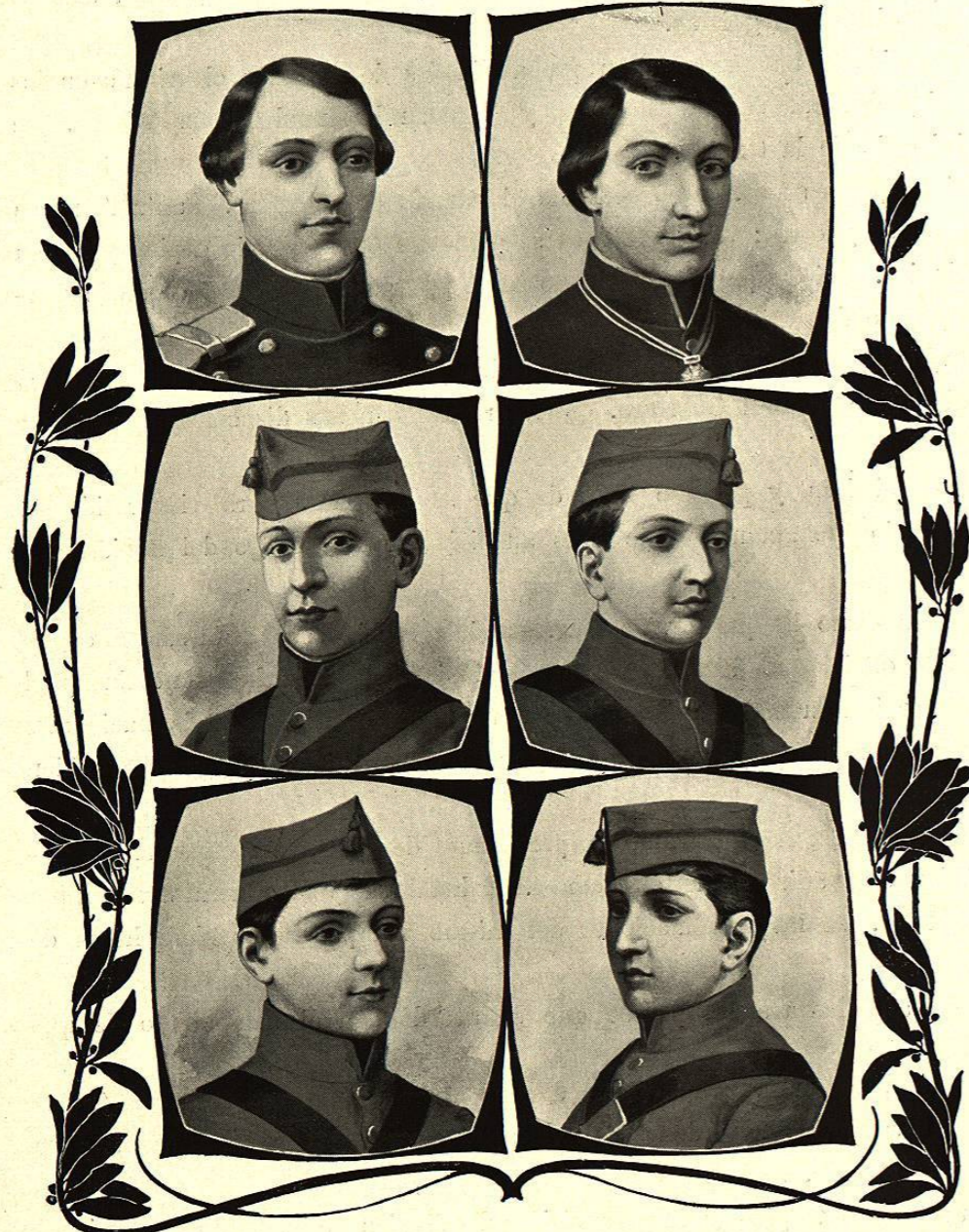
Alumnos del Colegio Militar, muertos en la defensa de Chapultepec

El Presidente se defiende con las armas en la mano, y el 18 de Septiembre de 1832 libra una famosa