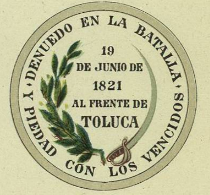
5- CRUZ Y ESCUDO DE CORDOBA. 6- CRUZ Y ESCUDO DE TOLUCA.-