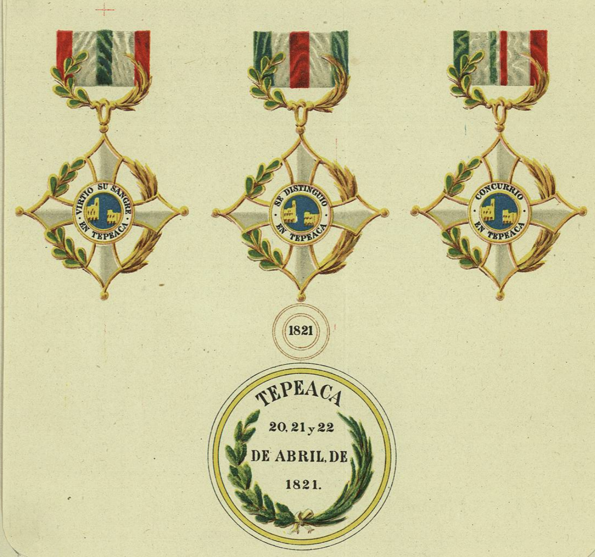
3- CRUCES Y ESCUDO DE TEPEACA.