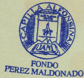
LÁMINA 1 A