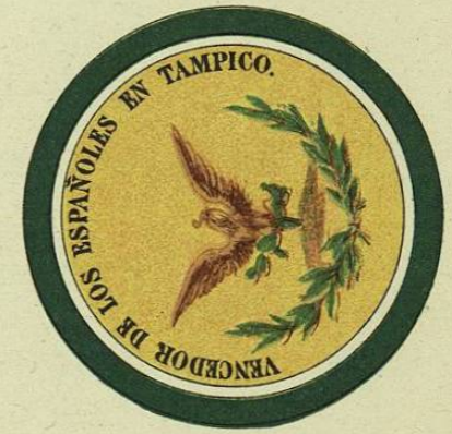
11- MEDALLAS DE HONOR Y ESCUDO POR LA BATALLA DE TAMPICO, EL 11 DE SEPTIEMBRE DE 1821.