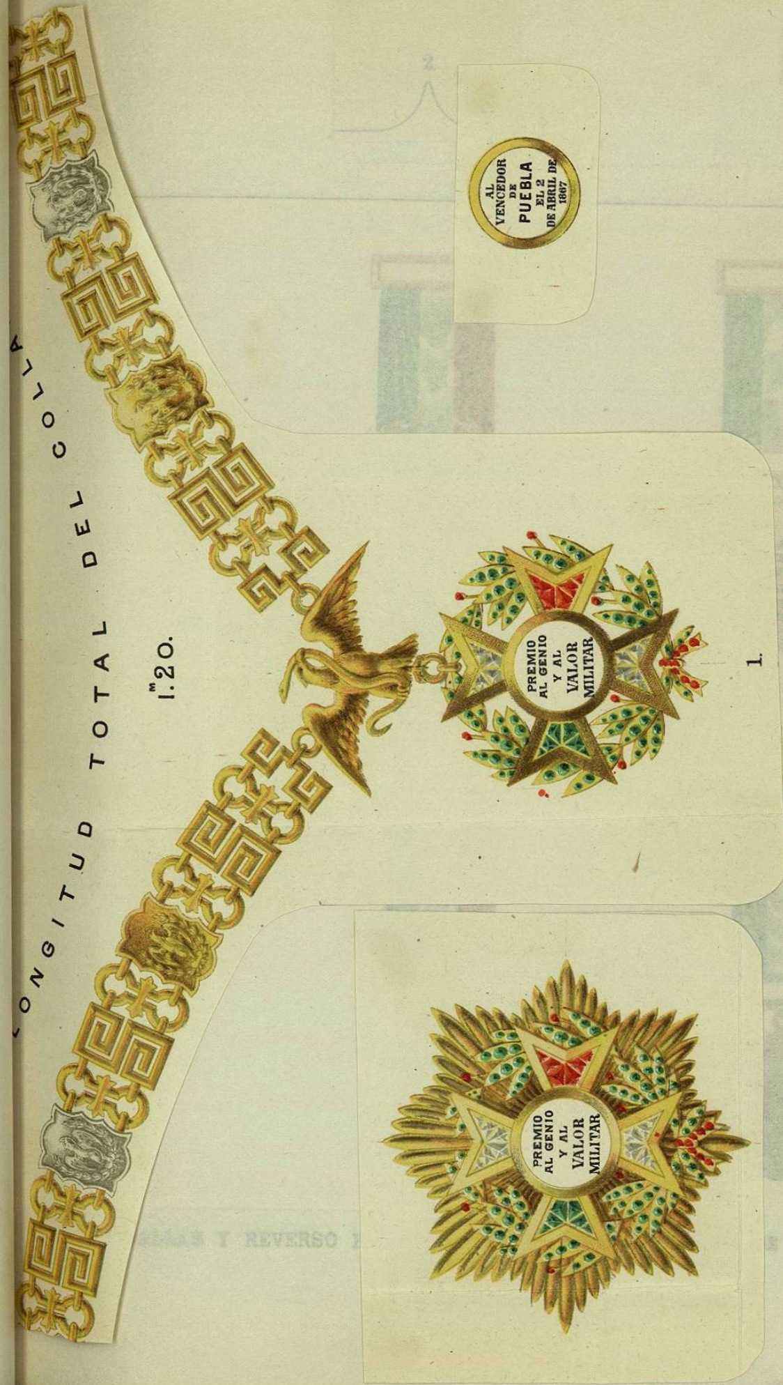
1- COLLAR, CRUZ, PLACA Y REVERSO DE LA CONDECORACION CONCEDIDA AL GENERAL EN JEFE DEL EJERCITO DE ORIENTE, (GRAL. PORFIRIO DIAZ) POR LA BATALLA DEL 2 DE ABRIL DE 1867.