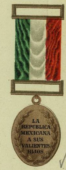
2- MEDALLAS Y REVERSO POR EL COMBATE DE LAS CUMBRES DE ACULTZINGO.