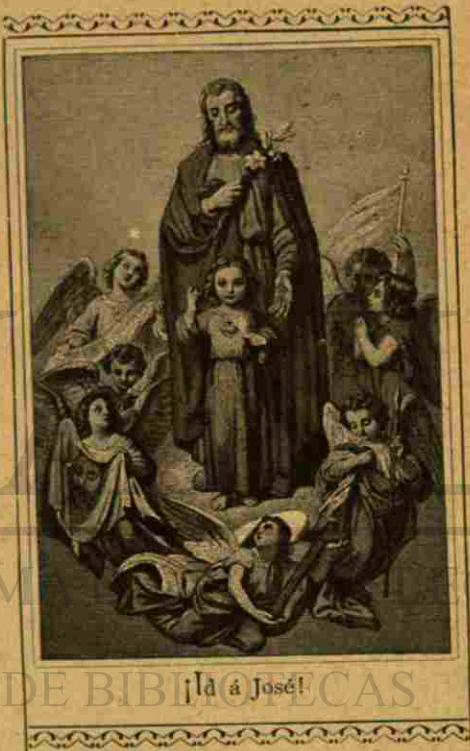
¡la á José!

La Hora Santa es también un ejercicio de oración . Es una hora empleada en orar por sí mismo y por los demás. ¡Ah! ¡cuán necesaria es la oración del hombre para perseverar en la gracia de Dios! Es bueno, sin duda, decir con frecuencia al Cora-