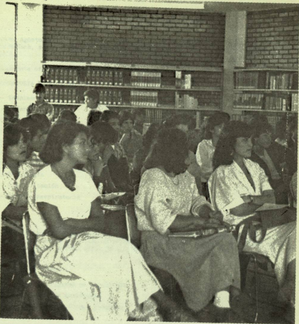
ESCUELA PREPARATORIA TECNICA MEDICA