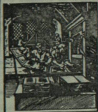
Impresores trabajando, con caja de tipos y tímpano. Frankfurt-am-Main, 1658.

Otros inventos y perfeccionamientos técnicos fueron: el reloj de bolsillo; la imprenta que dió principio a la industria gráfica, que por supuesto permitió la más amplia difusión de las ideas de todo tipo; la brújula, etc.