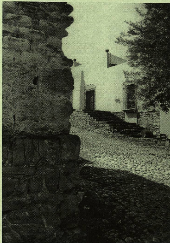
Villa de Santiago, N.L.

* Historiador, Cronista y Promotor Cultural.