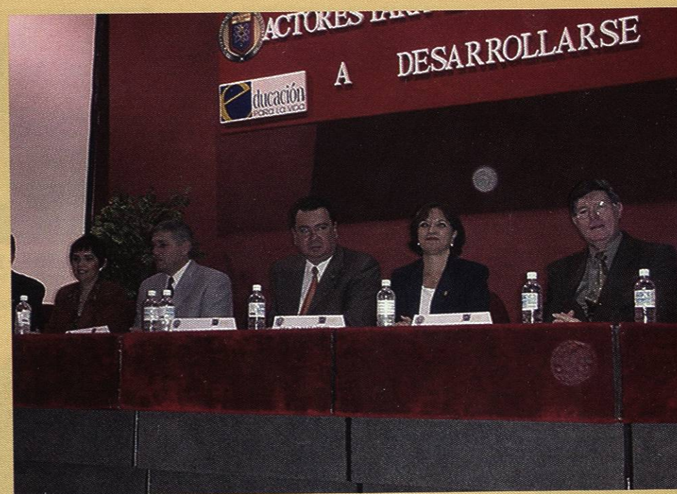
Presidium de la primera reunión anual del programa de Búsqueda y Desarrollo de Talentos de la Universidad Autónoma de Nuevo León, noviembre de 2001