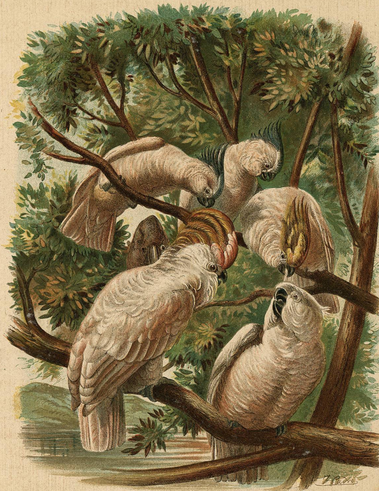
GRUPO DE CACATÚAS

CAUTIVIDAD. — El licmeto násico la resiste largo tiempo, segun parece: hoy día se le vé en Europa mucho mas á menudo que en otro tiempo, si bien no es todavía una especie comun en las colecciones. Gould dice que el individuo cautivo se contrista y es mas desagradable y fácil de irritarse que los otros cacatúidos, opinion de que participo igualmente. Hasta en un año que posemos uno, y aun no reconoce bien á su semejante, pues la semejanza siempre con su pico apenas se acerca, se cubren que le amarian, y todo le enfurece. Cuando está en estado de cólera se abanicó el pequeño moño que cubre su frente, baja y levanta la cabeza, abre el pico y lanza gritos fuertes. En las bandadas que pro-