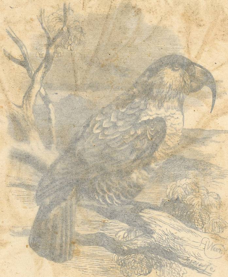
Fig. 19. — EL NESTOR DE PICO LARGO

USOS, COSTUMBRES Y RÉGIMEN. — Ignoramos completamente cuál es el género de vida del cacatúido; únicamente se