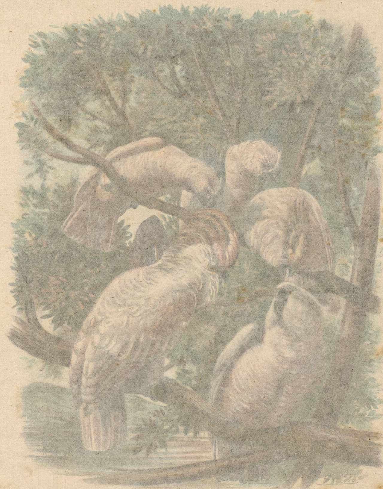
GRUPO DE CACATÚAS

CAUTIVIDAD. — El licmeto násico la resiste largo tiempo, segun parece: hoy dia se le vé en Europa mucho mas á menudo que en otro tiempo, si bien no es todavia una especie común en las colecciones. Gould dice que el individuo cautivo se contrista y es mas desagradable y fácil de irritarse que los otros cacatúidos, opinion de que participo igualmente. Hace ya un año que poseemos uno, y aun no reconoce bien á su guardian, pues le amenaza siempre con su pico apenas se acerca; no tolera que le acaricien, y todo le enfurece. Cuando está irritado, endereza en forma de abanico el pequeño moño que cubre su frente, baja y levanta la cabeza, abre el pico y lanza gritos furiosos. En los sonidos que pro-