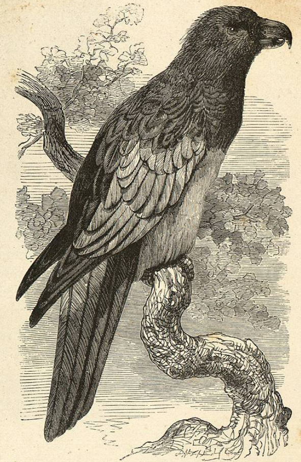
Fig. 20.—EL DASIPTILO DE PESQUET

La especie que ha servido de base á Wagler para formar su género dasyptilus no es menos singular que la descrita de los nestores, con la cual guarda cierta semejanza. Distinguese de todas las que