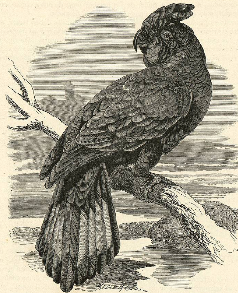
Fig. 22. — EL CALIPTORINCO DE BANKS

»Diferenciándose en esto de todos los demás loros, se vale de