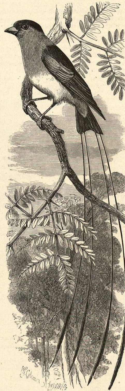
Fig. 54.—EL TETRENURO REAL

pero la hembra no pone mas que huevos estériles; los machos se aparean á veces con otros pájaros. Se les dá el mismo alimento que á las demás especies, aunque añadiendo de vez en cuando á los