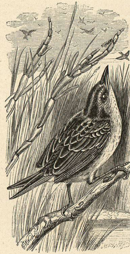
Fig. 56. — EL AMODROMO MARÍTIMO

CARACTÉRES. —Los pájaros de esta especie tienen el lomo rojo pálido, y como manchado de negro, siendo de este tinte los tallos de las plumas; la cara inferior del cuerpo es blanca, con motas de un pardo oscuro en el pecho y grandes manchas del mismo color en los costados; la mandíbula superior es oscura y la inferior