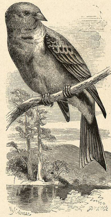
Fig. 59.—EL EMBERIZA HORTELANO

En la época del celo se retiran á las colinas incultas cubiertas de salvias y de azufaios, á los viñedos y á los jardines poco frecuentados. El macho se posa en la rama mas alta de un árbol ó de un jaral, y deja oír continuamente su canto sencillo, un poco afilado, mientras que la hembra se oculta todo lo posible. El nido, formado en tierra, ó en un espinoso matorral, no suele estar á la vista; su construccion es muy tosca; algunos tallos y hojas, entrelazadas sin órden, forman la pared exterior, y por dentro está relleno de pe-