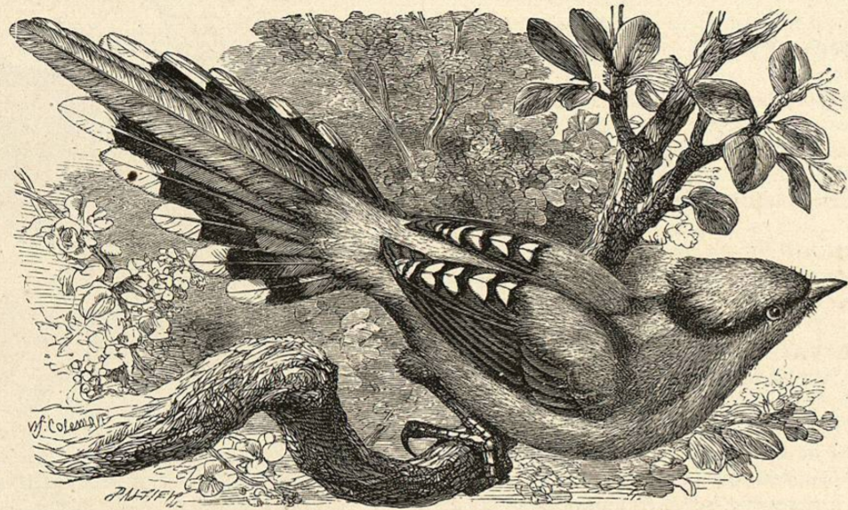
Fig. 104. — EL KITO DE LA CHINA

En el sur y el este de Asia existen varias aves magníficas, que han sido clasificadas por ciertos naturalistas entre los coraciostros, mientras que algunos las presentan como tordos ó coracias; pero