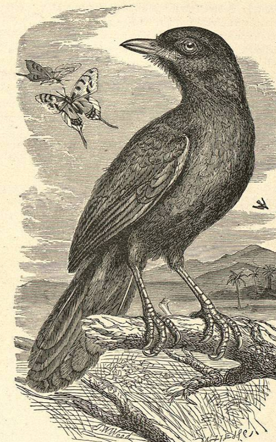
Fig. 234.—EL GARRULAXO DE CHINA

profunda; está abierto comunmente por arriba; á veces tiene una abertura oblicua y lateral. Todos los nidos que yo encontré se componian tan solo de hojas de alang-alang, solo que las del interior eran mas finas y estaban mejor entrelazadas que las del exterior. La construccion es endeble; carece completamente de solidez, y por lo mismo es necesario levantar el nido con precaucion si se quiere evitar que se deshaga ó se altere su forma. Cada uno contiene dos ó tres huevos blancos, sembrados de puntos de un rojo pardo, mas ó menos intenso, mayores y mas compactos en la punta gruesa, donde forman una especie de corona. A veces presentan tambien