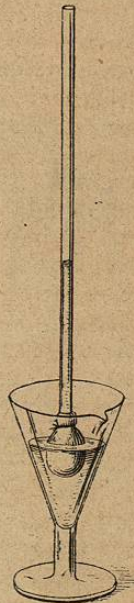
Fig. 5. Endosmomètre.

1° Osmose. — On sait, depuis DUTROCHET, que lorsque deux liquides hétérogènes et miscibles sont séparés par une membrane poreuse, il s'établit à travers la membrane deux courants de sens contraire, d'intensité inégale, dont le plus fort est appelé endosmose et l'autre exosmose . Si l'on met dans un sac membraneux, un cæcum de poulet par exemple, lié sur un tube de verre, une solution concentrée de sucre, et si l'on plonge cet appareil, nommé endosmomètre , dans un vase contenant de l'eau pure, au bout de quelque temps on constate que les deux liquides sont également sucrés. On appelle équivalent endosmotique d'une substance la quantité d'eau qui passe à travers la membrane, pendant que 1 gramme de substance dissoute traverse la même membrane en sens inverse. Certaines substances, comme l'albumine, ne passent que très difficilement et ont, par conséquent, un équivalent endosmotique fort élevé; pour d'autres, au contraire, les sels par exemple, l'osmose est très rapide et l'équivalent endosmotique faible. GRAHAM a donné aux premières le nom de colloïdes , aux secondes celui de crystalloïdes . Lorsque deux substances dont l'équivalent endosmotique est très différent sont mélangées, on peut les séparer en mettant à profit cette différence; cette méthode porte le nom de dialyse ; ainsi on peut séparer de cette façon les peptones de l'albumine; car les peptones traversent très facilement les membranes, sont dialysables en un mot, tandis que l'albumine ne l'est que fort peu.