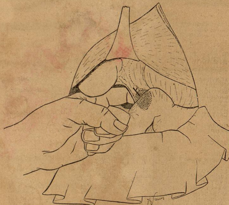
Fig. 37. — Cholecystectomie. — Vue générale de l'opération : un écarteur soulève le foie. L'andra gauche engagé dans l'hiatus de Winslow et recourbé en crochet derrière l'épiploon gastro-hépatique, amène en avant cet épiploon et le duodénum. Dans l'épaisseur de cet épiploon sous son feuillet antérieur, on aperçoit en pointillé le canal optique et le canal cholédoque dilaté. Un calcul rempli l'extrémité inférieure du cholédoque. L'incision destinée à l'extraire sera faite en I sur le calcul, au-dessus du duodénum, parallèlement au canal loin de la veine porte qui est située dans la profondeur derrière le canal. L'incision sera au besoin agrandie vers le bas en attirant le duodénum en bas et en dedans.

La ponction avec une aiguille, en permettant de sentir le calcul, donnera une certitude complète.