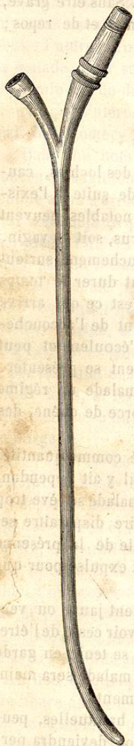
Fig. 249. — Sonde d'AVRARD.

« Il faut avoir soin d'imprimer à la sonde des mouvements de rotation, puis de va-et-vient, pour favoriser le contact de tous les points de la surface interne de la matrice par le liquide injecté. Si le liquide ne revient pas instantanément, soit par la branche libre de la sonde, soit par la vulve, il faut s'arrêter pour éviter la distension possible de la cavité de la matrice par le liquide, retirer de la sonde, la déboucher, puis la remettre en place une fois le liquide écoulé.