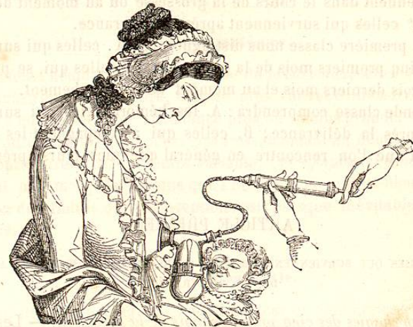
Fig. 253. — Téterelle THIERS.

Si les bouts de seins manquent ou sont mal formés, il faut essayer de les faire avec des téterelles, le tire-mamelon de Mathieu (fig. 251), le tire-lait atmosphérique de Leplanquais (fig. 252), ou la téterelle Thiers