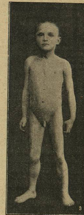
Tome V. Fig. 81.