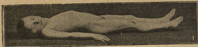
Tome V. Fig. 73.

que soulève l'étude de l'homme; elle éloigne le médecin des changeantes données de l'empirisme et lui apprend à réfléchir sur les phénomènes qu'il observe, à discuter et à comprendre les interventions qu'il doit faire.