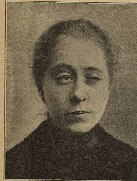
Tome V. Fig. 233. — Blépharospasme hystérique avec hémianesthésie correspondante.