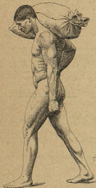
Tome I. Fig. 180. — Marche avec un fardeau sur l'épaule.

Les tomes I et II sont vendus 25 fr. chaque. On souscrit dès maintenant à l'ouvrage complet au prix de 70 fr. — Ce prix restera tel jusqu'à la publication du tome III.