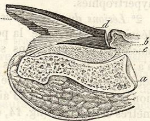
FIG. 14. — Coupe d'une hypertrophie de l'ongle et du derme sous-unguéal. — a , phalange; b , repli cutané rétro-unguéal; c , lit hypertrophié de l'ongle; d , lamelle superficielle de l'ongle; e , ensemble de lamelles sèches et minces comprises entre la couche superficielle d et le lit de l'ongle.

La substance qui constitue cette hypertrophie des ongles est sèche, surtout à la superficie, où l'humidité des couches profondes n'arrive plus ; elle est en même temps cassante et d'un blanc jaunâtre. Sa structure microscopique est celle de toutes les productions épidermiques, mais on ne peut bien l'étudier dans ses éléments qu'en traitant par une solution de potasse ou de soude une coupe mince de ces ongles. On voit alors se séparer les unes des autres des cellules épidermiques pavimenteuses à petit noyau (fig. 16), absolument identiques avec celles de l'épi-