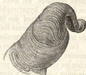
FIG. 15. — Hypertrophie de l'ongle deux fois courbé sur lui-même.