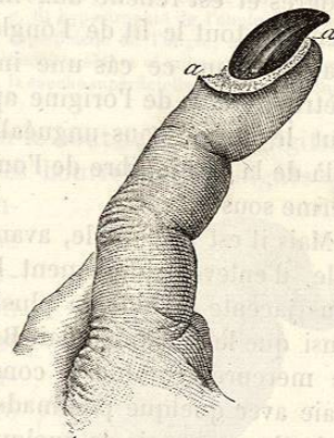
FIG. 13. — Onxyis rétro-unguéal. — L'ulcération aa , d'abord née dans le repli postérieur de l'ongle, a fini par entourer complètement cette lame cornée, qui est devenue noire, s'est épaissie et a pris une forme spéciale.

TRAITEMENT. — Le traitement de l'onxyis sous-unguéal et rétro-unguéal varie suivant la cause de la maladie. On peut quelquefois prévenir cet accident en traitant d'abord par les réfrigérants les contusions de l'ongle;