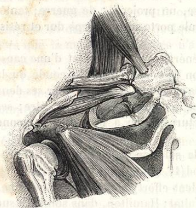
FIG. 195. — Fracture oblique de la clavicle à la partie moyenne. — Mécanisme du déplacement.

Si la fracture est transversale ou oblique en dedans et en arrière, voici par