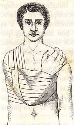
FIG. 198. — Appareil inamovible de Velpeau pour les fractures de la clavicule.

Cet appareil, qui a l'avantage de se déplacer moins facilement que l'appareil de Desault, n'est cependant pas à l'abri de tout reproche; outre qu'il est insuffisant à remédier au déplacement, il exerce sur les téguments une pression pénible, parfois des excoriations et même de véritables eschares.