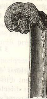
FIG. 205. — Fracture par pénétration de la tête humérale.

SYMPTOMATOLOGIE. — Outre les signes que nous avons dit être ceux de la fracture du col, nous trouvons ici un remarquable élargissement de la tête de l'os, par suite de la pénétration réciproque des fragments. Cela a lieu surtout dans les fractures qui n'intéressent que la grosse tubérosité. Smith explique ce fait de la manière suivante: Le fait de la séparation de la grosse tubérosité humérale du reste de l'os a pour résultat d'annuler l'action qu'ont sur l'humérus les muscles petit rond, sus et sous-épineux. Rien ne contre-balance plus alors l'action du sous-scapulaire et de la partie antérieure du deltoïde qui attirent fortement la tête en dedans, contre la partie interne du ligament capsulaire. Ce déplacement étant