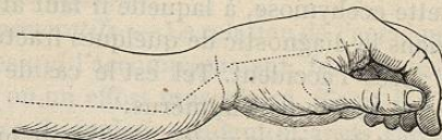
FIG. 167. — Déformation en dos de fourchette de l'extrémité inférieure de l'avant-bras dans la fracture du radius.

cial : telle est, par exemple, la disposition du poignet en dos de fourchette (fig. 166) dans la fracture de l'extrémité inférieure du radius, disposition dont la figure ci-dessous donne sur le vivant une bonne idée (fig. 167).