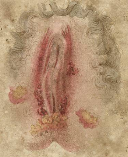
Végétations & ulcérations.