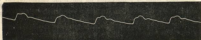
FIG. 21. — Anévrysmes de l'aorte. Artère radiale droite. (Lorain.)

Les recherches de Marey et de François-Franck ont démontré que la vitesse de transmission de l'onde est notablement diminuée par l'interposition d'une poche extensible ; le mouvement qui à l'état normal anime les artères d'une façon intermittente se trouve par cela même transformé en un mouvement presque continu. Ces caractères sont appréciables sur les tracés fournis par les deux artères radiales ou par l'artère radiale gauche seulement, suivant le siège occupé par la tumeur (fig. 21 et 22).