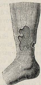
Fig. 16. — Ulcère de la jambe avec complication de varices.

L'ulcère simple ainsi établi représente une solution de continuité d'étendue et de formes variables. Certains ulcères peuvent atteindre de grandes dimensions, et à la jambe, par exemple, circonscrire toute la partie inférieure du membre et s'étendre vers le pied. Boyer fait remarquer, avec raison, que dans la mesure des ulcères il faut tenir compte de l'engorgement des parties. Lorsque celles-ci sont tuméfiées, les bords de l'ulcère s'écartent, et ils ne se rapprochent qu'après le dégorgeement des tissus.