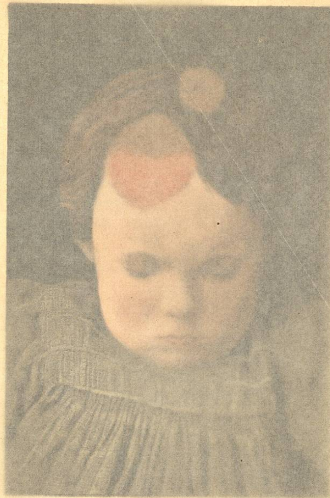
Pl. XLVI. — Trichophytie du cuir chevelu.

Marche. — Aucune règle fixe ne peut être établie concernant la marche de la trichophytie du cuir chevelu qui