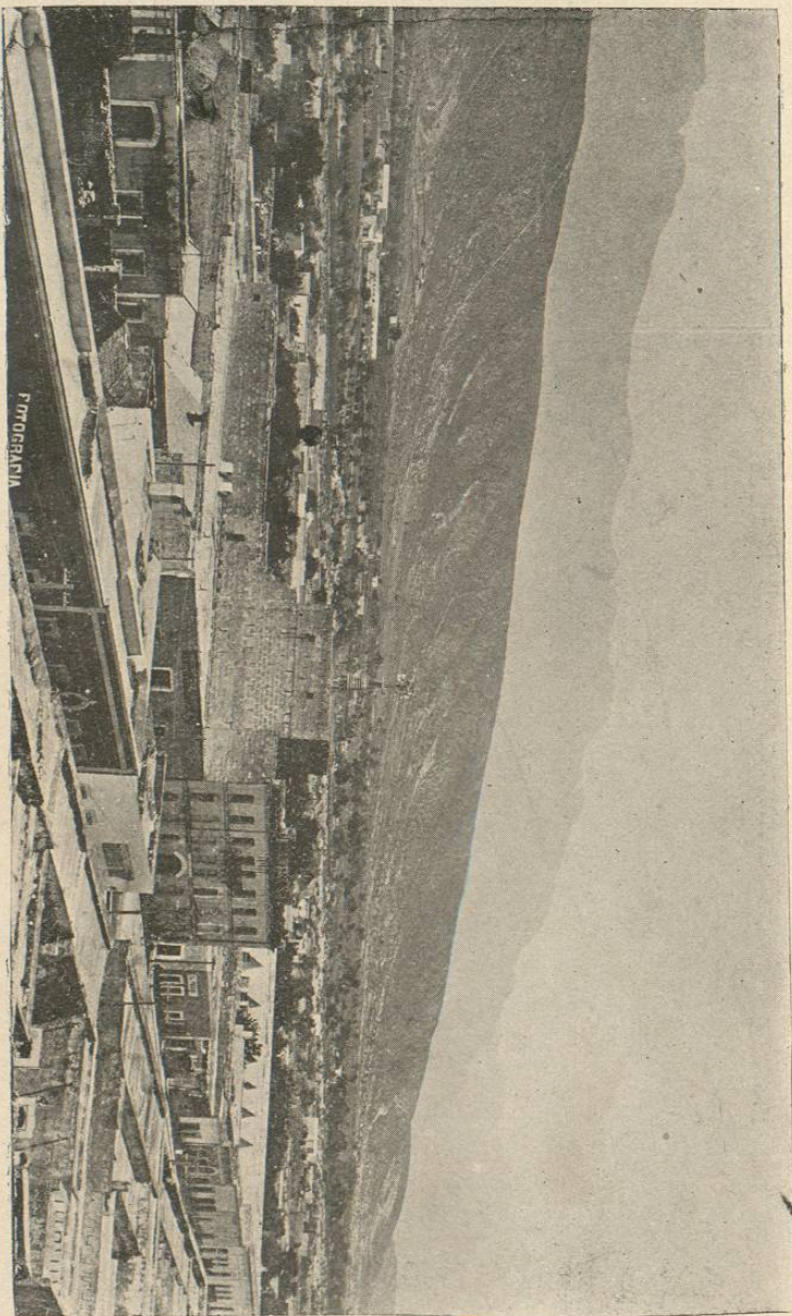
Tomás al Sur de la Ciudad.