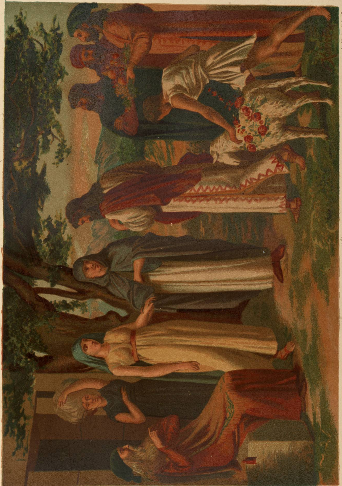
Los Mirrales, Unión 17.

Se puede alegar que algunas de estas uniones se realizaban en circunstancias especiales, como en el caso de los Incas, que se casaban con sus hermanas para asegurar la sucesión del reino.