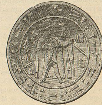
Sello de Tarkondemos (Tarku-dimmi).

crecerse otra vez con su rey Rusa ó Ursa, sucesor de Sarduri; mas no fué éste, á lo que parece, el que entonces excitó á rebelarse contra la Asiria á los Estados vecinos, ya que una parte del territorio maneo y el rey Mitatti de Zikirtu (4), que estaba en alianza con él, dieron el primer motivo para la guerra, que, con muy breves intervalos, duró desde 719 hasta 714 y en la cual tomó luego parte muy principal Rusa, cuando vió que podia contar con sus vecinos así del Este como del Oeste. El adversario que durante toda esta guerra dió mas quehacer á Sargon, y resultó mas temible para la Asiria que los armenios, fué seguramente Mannash. Cierto que segun los anales de Sargon parece que el rey maneo á la sazón, Iranzu, habia sido fiel vasallo de Assur; mas es posible que esta lealtad se limitara á que Iranzu, habiendo visto la humillacion de la Armenia por Teglafalasar, se apresu-