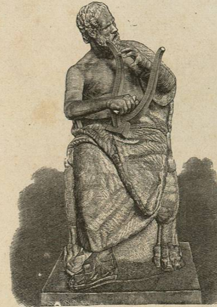
Anacreonte (Quinta Borghese)

Ejerció Pericles su influencia en favor de los representantes de la arquitectura y de las artes plásticas, las cuales dieron