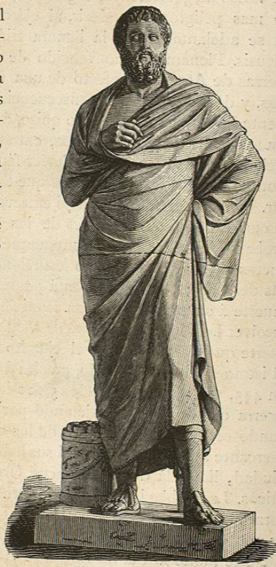
Sófocles (Roma, Letran)