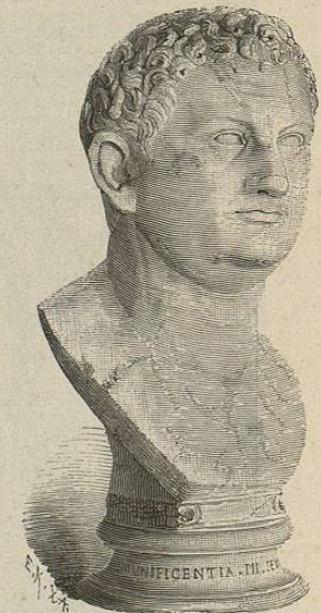
Tito (Roma, Vaticano)

dedicara grandes sumas, probablemente por vez primera en el imperio romano, á la instruccion superior de la juventud romana, además de sus liberalidades para con los poetas y artistas. Fué el primer emperador romano que pensó en la instruccion y educacion de la juventud, abandonando el sistema de indiferencia con que los primeros emperadores habian mirado los trabajos de los profesores griegos y latinos. En la historia del siglo II de nuestra era veremos las consecuencias interesantes y en parte provechosas del apoyo que Vespasiano dió á la instruccion. Entonces se desarrollaron varios grandes centros de enseñanza, si bien este no fué el objeto principal de Vespasiano, que solo queria reconciliar con el imperio á la clase tan influyente en la alta sociedad de profesores y literatos, cuyos ideales políticos se cifraban en la república. La introduccion de profesores (gramáticos y