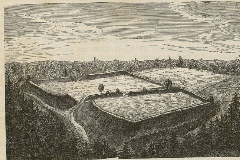
Muro romano cerca de Deisenhofen. Mayor altura sobre el nivel del valle 38 metros. Longitud total 187 metros, ancho 85 metros en un extremo y 130 en el otro

A kilómetro y medio del campamento en direccion Nor-