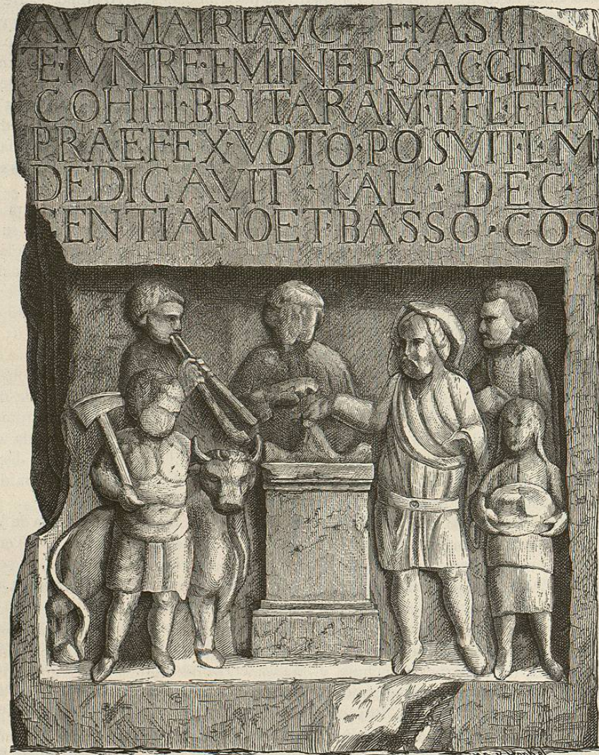
Altar romano que representa un sacrificio (1)

Otra carretera atravesaba el Vinstgau, el país de los venes, que arrancaba de Teriolis (Castillo Tirol) por Telonia hoy Toell cerca de Meran hasta Landeck, y de allí por