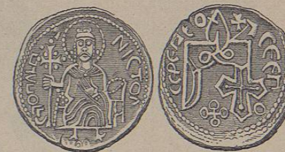
Moneda de plata de Swiatopolk

Por análogos medios habian fundado recientemente sus soberanías otros príncipes eslavos vecinos, como por ejemplo, Boleslao el Valiente, en Polonia, y Boleslao el Rojo, en Bohemia: ¿por qué, pues, no podia imitar su ejemplo Swia-