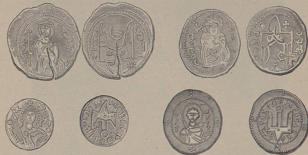
Monedas de plata de Yaroslao

existían. Estos supieron conservar su libertad y hablaron con altanería á su príncipe, convencidos como estaban de lo necesarios que le eran. También se pusieron de acuerdo entre sí para su provecho, pues cuando Yaroslao, creyéndose ya seguro después de haber vencido á Swiatopolk, se mostró negligente en el pago de sus sueldos á los mercenarios warangos, se pusieron al servicio de su sobrino Briatchislao, que residía en Polozk, el cual en 1021 emprendió con éxito una campaña de rapiña contra Nowgorod. La tradición rusa dice que en aquella lucha resultó vencedor Yaroslao, á pesar de lo cual vemos que firmó con Briatchislao una paz para él desventajosa. La explicación de este hecho tan extraño se encuentra en la Eymundar-Saga . Los warangos derrotados consiguieron apoderarse de Ingegerda, la esposa más influyente de Yaroslao, y como precio de su rescate exigieron el reconocimiento de la situación territorial de Briatchislao y la cesión de las ciudades de Witebsk y Uswjat. Desde entonces, y durante todo el tiempo que duró su reinado, Yaroslao mantuvo las más cordiales relaciones con el Norte escandinavo. Poco