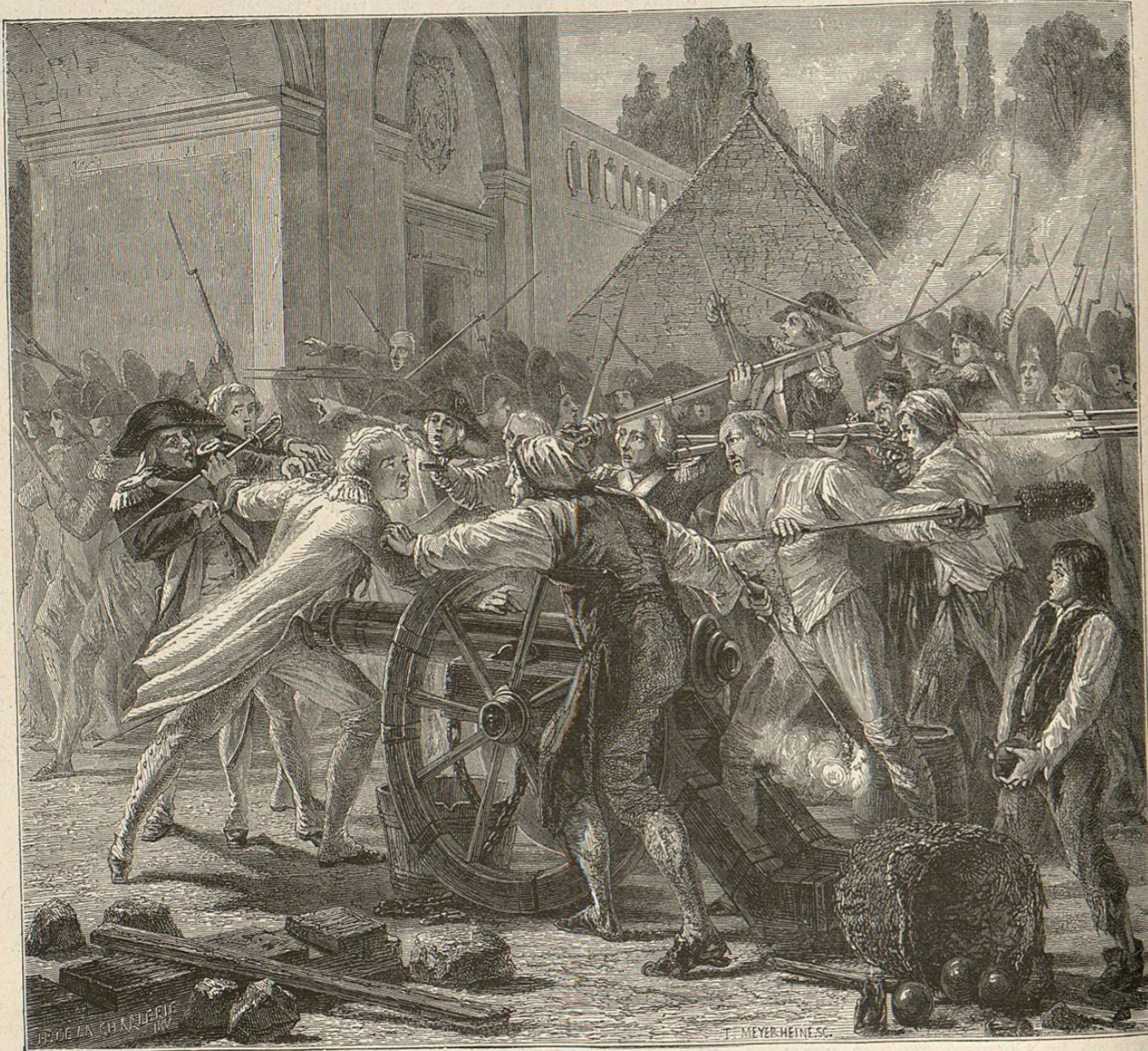
Accion heroica de Desille

en cambio continúan los de Francia. El emperador, lejos de apoyar los planes ó pretensiones de los emigrados, insiste en que permanezcan tranquilos, y los príncipes del imperio siguen su ejemplo. Ninguna potencia los auxilia con tropas, y en cuanto al dinero que la compasión que inspira su desgracia haya podido hacer llegar á sus manos, apenas basta para su subsistencia. No, la verdadera causa de la agitacion y de todas las consecuencias que pueda traer consigo, demasiado clara se presenta á los ojos de Francia y á los de