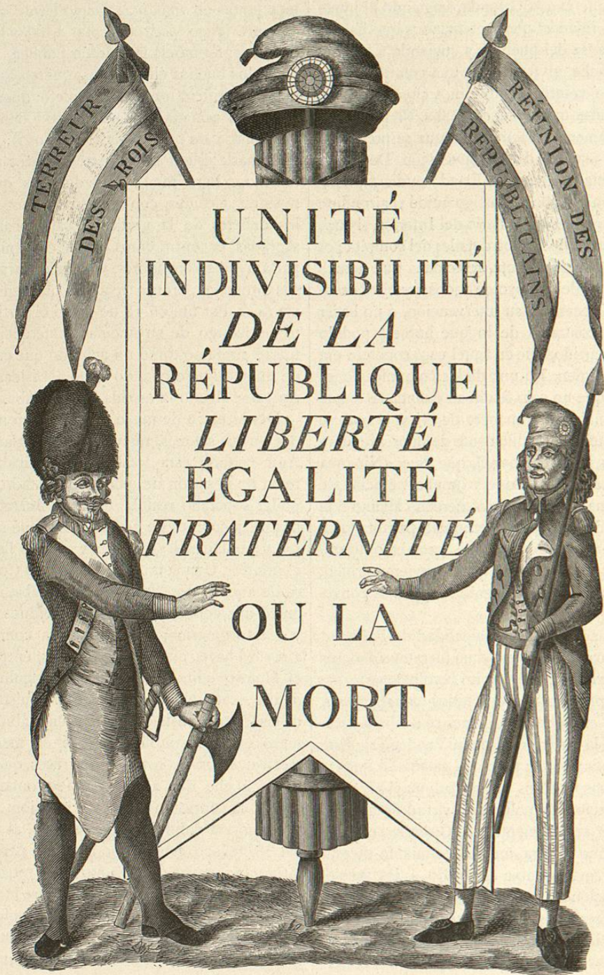
Facsimile de un cartel que los ciudadanos fijaron al exterior de sus casas para dar testimonio de su republicanismo

3.º Fijacion del precio del pan en tres sueldos la libra en los departamentos, por medio de un suplemento de fondos que pagarán los ricos.