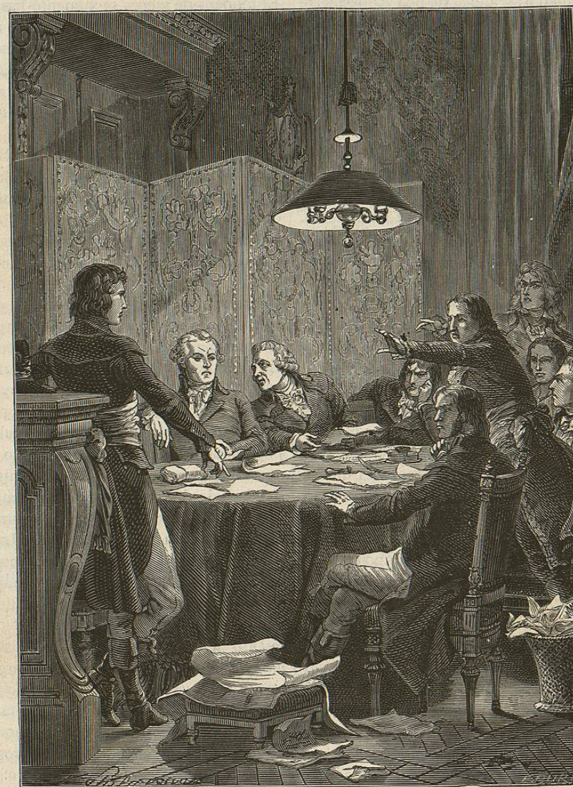
La Comision de Salvacion pública

que la fiesta fuese en definitiva ni mas ni menos que el suntuoso preámbulo de nuevas matanzas. Y sin embargo, de esto precisamente se trataba y nunca se habia pensado en otra cosa, pues el primer discurso que pronunció aquel día Robespierre, como presidente de la Convencion, terminó con estas palabras: «¡Pueblo, entreguémonos hoy, protegidos por la divinidad, á las emociones de una alegría pura! Mañana volveremos á combatir contra los criminales y contra la tiranía.» Esto concordaba perfectamente con la explicacion que