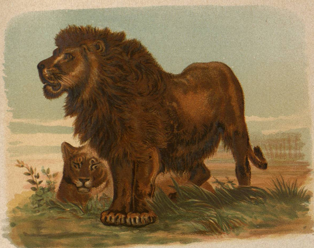
LEON DE BERBERIA

El leon de Goostrate, segun se encuentra, segun se describe por su considerable tamaño, no debemos considerarlo como una especie nueva. El leon de Goostrate, segun se encuentra, segun se describe por su considerable tamaño, no debemos considerarlo como una especie nueva.