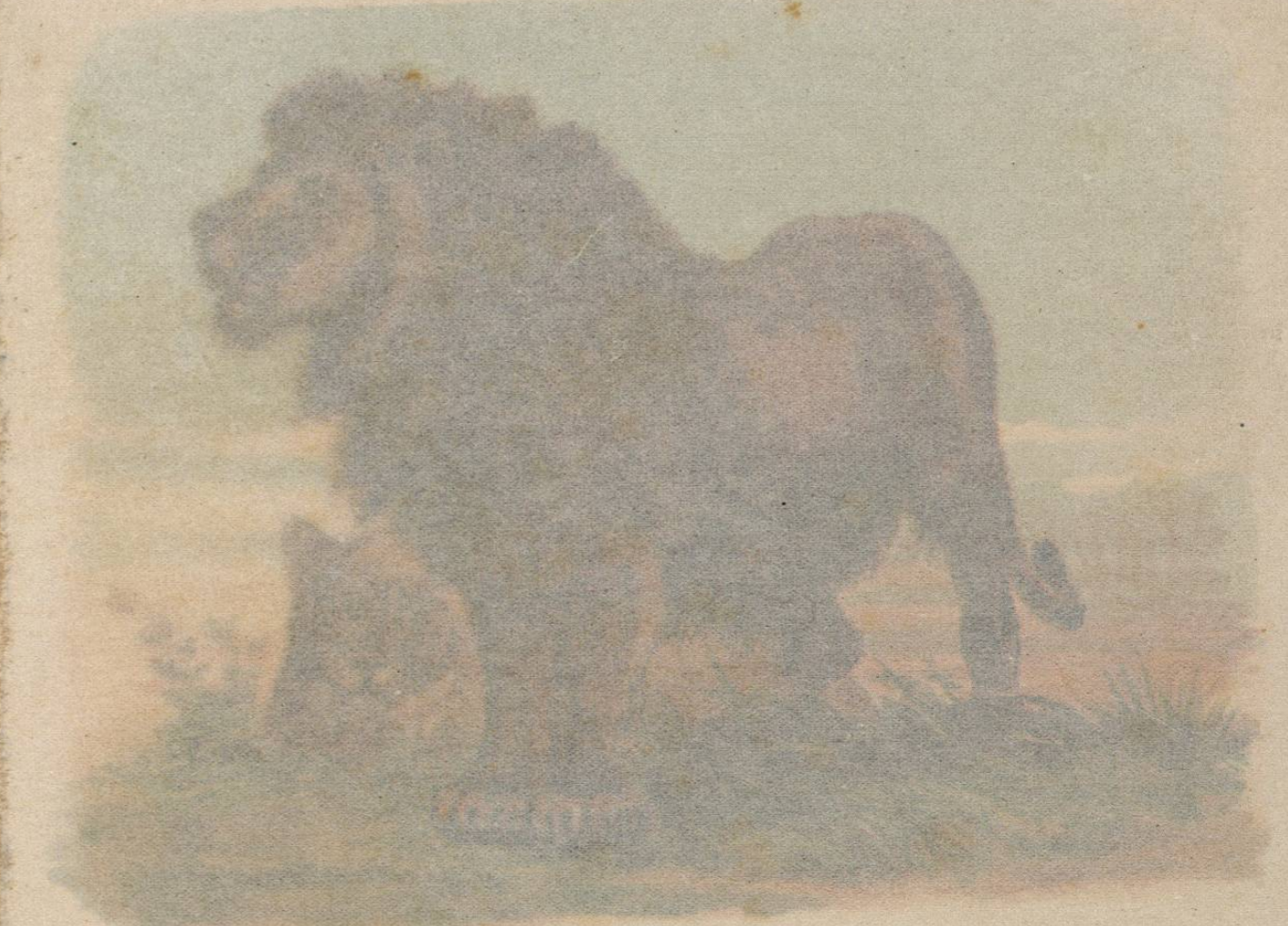
LEÓN DE BERBERÍA

CARACTERES. —Este felino, llamado también león sin crin , oediabagh ó tigre camello por los indígenas, ha sido descrito primero por Smee, el cual ha formado de él una especie separada. Es mucho más pequeño que sus congéneres, de que acabamos de hablar. Su color es rojizo leonado y solamente el mechón de la cola es blanco; carece casi completamente