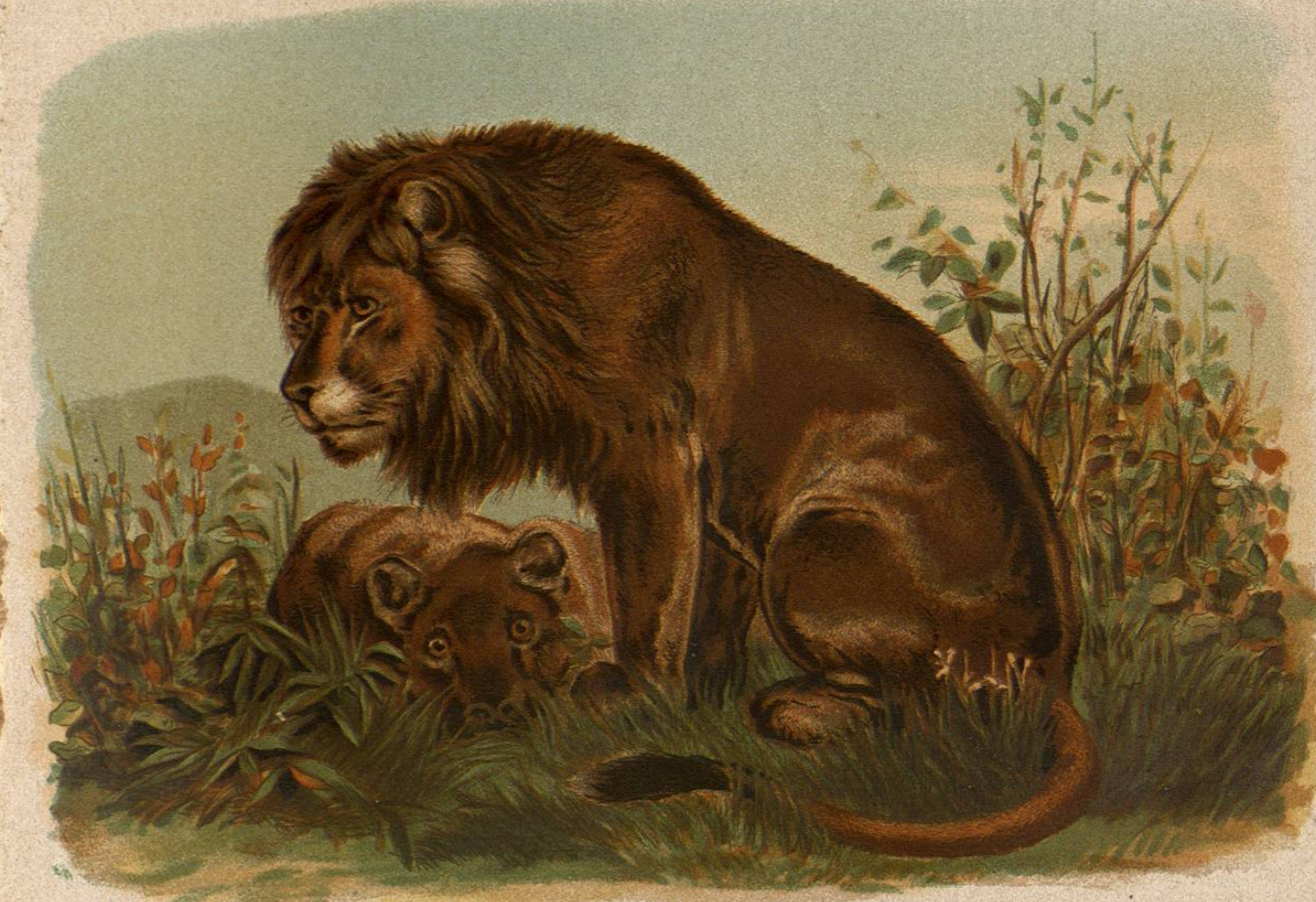
LEON DE GUZERATE