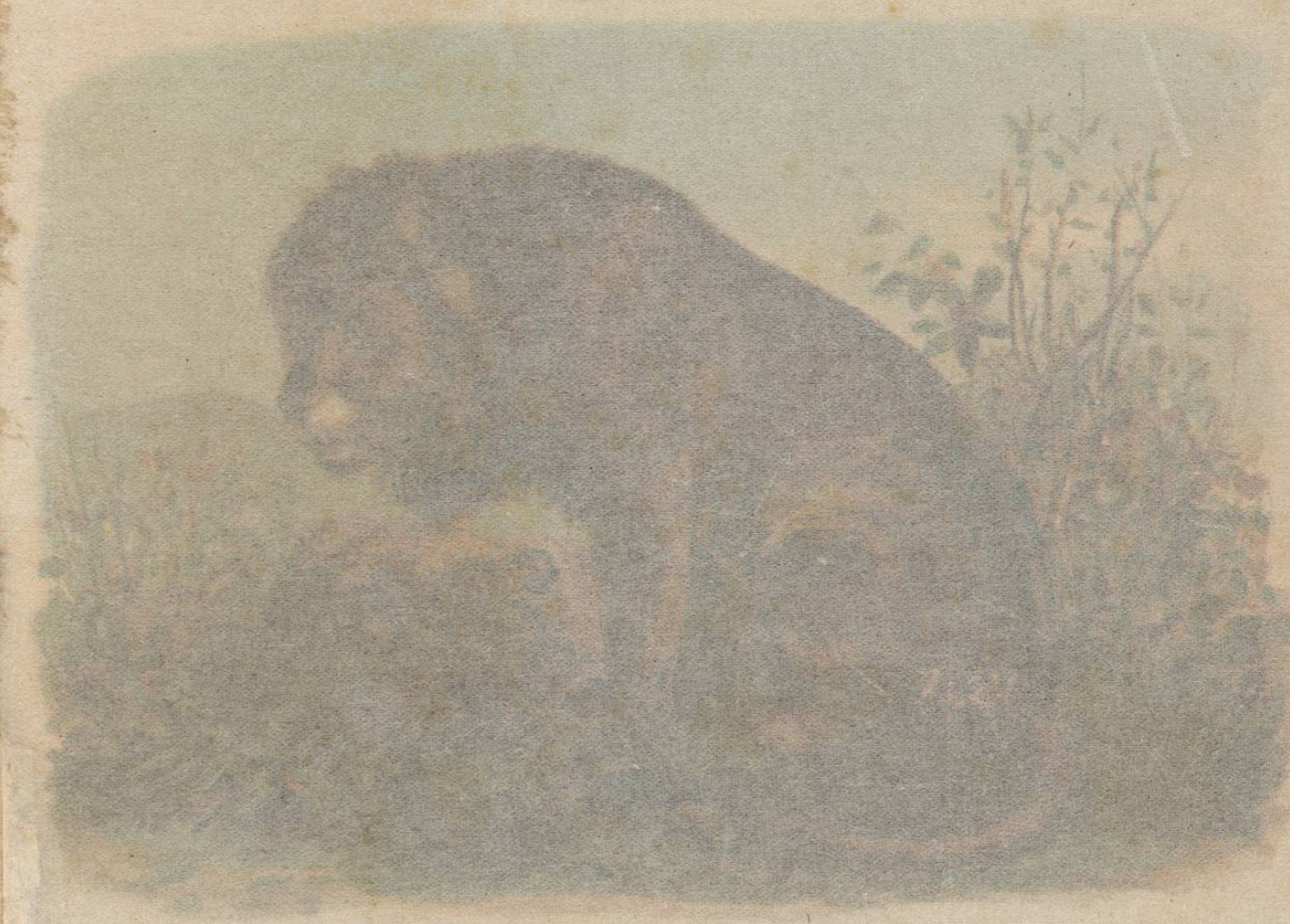
LEÓN DE GUZERATE