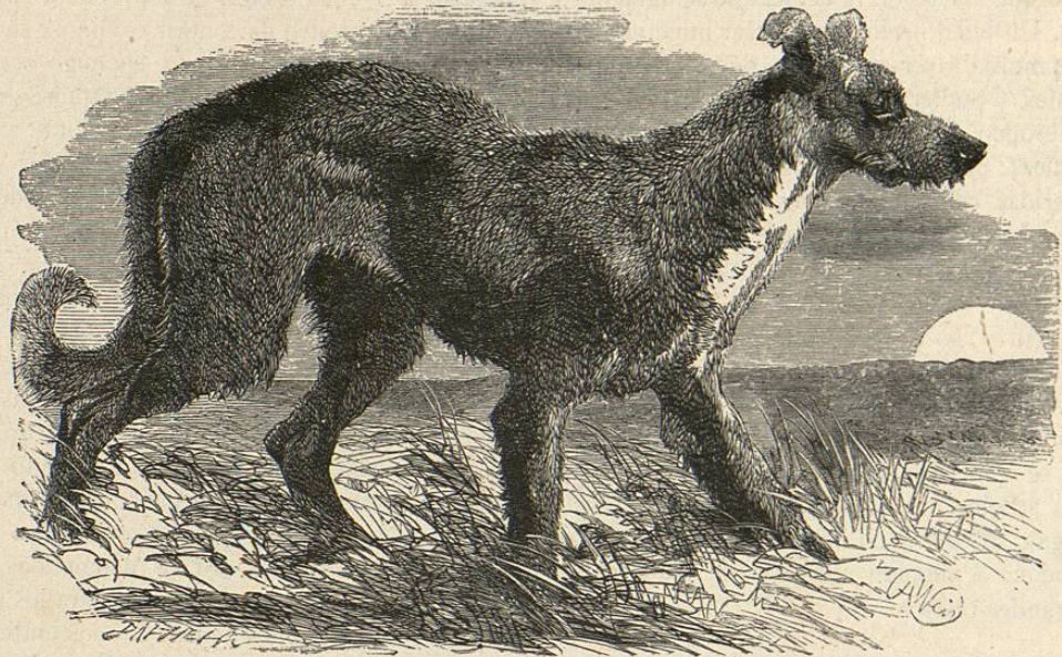
Fig. 192.—EL PERRO DE CAZADOR FURTIVO

»Estos perros son de varios colores: los hay blancos, grises, pardos, leonados, negros, etc.; pero en algunas provincias, y principalmente en Borgoña, la mayor parte de los individuos son del último color con manchas blancas, sin