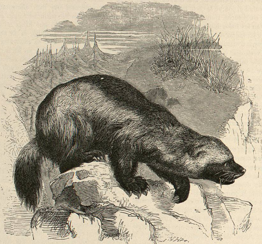
Fig. 284.—EL GLOTON ÁRTICO

cuando menos á juzgar por mis observaciones. Con sus pasos cortos parece mas bien que se arrastra y no que anda; deslízase ágil y diestro sobre todas las desigualdades; pero se queda en tierra y no quiere trepar. Por su libre voluntad no se arroja al agua, á no ser que allí se le presente alguna presa; pero de esto puede tener la culpa la jaula que carece de depósito de agua para nadar. En todos sus movimientos agita de continuo su cabecita inteligente; sus penetrantes miradas recorren todo el aposento sin parar un momento; mientras que sus pequeñas orejas se enderezan como si quisiesen observar lo que pudiera escapar á la vista. Si entonces se le alarga una