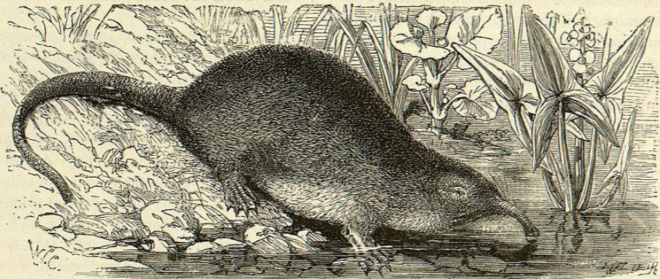
Fig. 11.—EL DESMAN DE LOS PIRINEOS

Su cuerpo delgado sostiene una cabeza que, muy ancha por detrás, se estrecha hácia adelante, igualando en longitud á la mitad del tronco. Tiene las orejas cortas, redondas y echadas hácia atrás; los ojos pequeños, aunque mayores que los del erizo propiamente dicho; el cuello mas corto y delgado que el cuerpo; las piernas de mediana extension, siendo las posteriores algo mas altas que las delan-